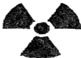
پسماند رادیو اکتیو