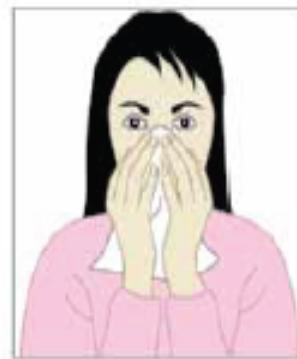
بینی و دهان خود را بپوشانید.