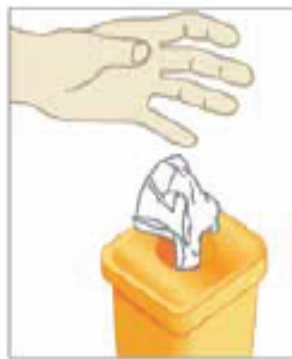
دستمال استفاده شده را بلافاصله در ظرف زباله مناسب بیاندازید.