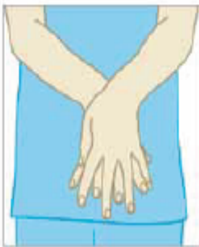
عملیات بهداشت دست ها را انجام دهید