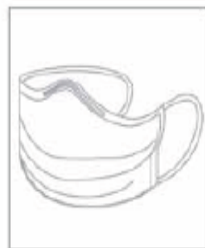
در صورتی که سرفه می کنید از ماسک طبی استفاده کنید.

انجام این اقدامات مهم برای کنترل منبع آلودگی همیشه ضروری است.