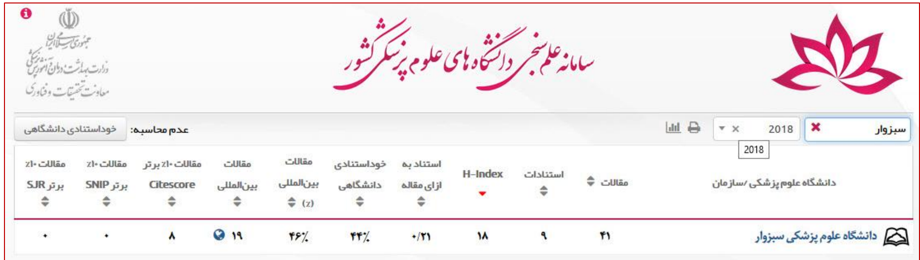
جدول ۱: مقایسه وضعیت کل علم سنجی دانشگاه با وضعیت از ابتدای سال ۲۰۱۸ تا پایان فرودین ماه ۹۷

وضعیت تولیدات علمی دانشگاه در سال ۲۰۱۸ در پایگاه Scopus، در سامانه علم سنجی دانشگاههای علوم پزشکی کشور، حاکی از آن است که استناد به ازای هر مقاله، ۰/۲۱ است، این در حالی است که میزان استناد به مقاله در کل مقالات دانشگاه، ۳/۱۴ است. در تصویر شماره ۱، وضعیت علم سنجی مقالات سال ۲۰۱۸ تا کنون نمایش داده شده است و جدول شماره ۱، مقایسه وضعیت علم سنجی دانشگاه از ابتدای سال ۲۰۱۸ تا پایان فرودین ماه ارائه شده است.